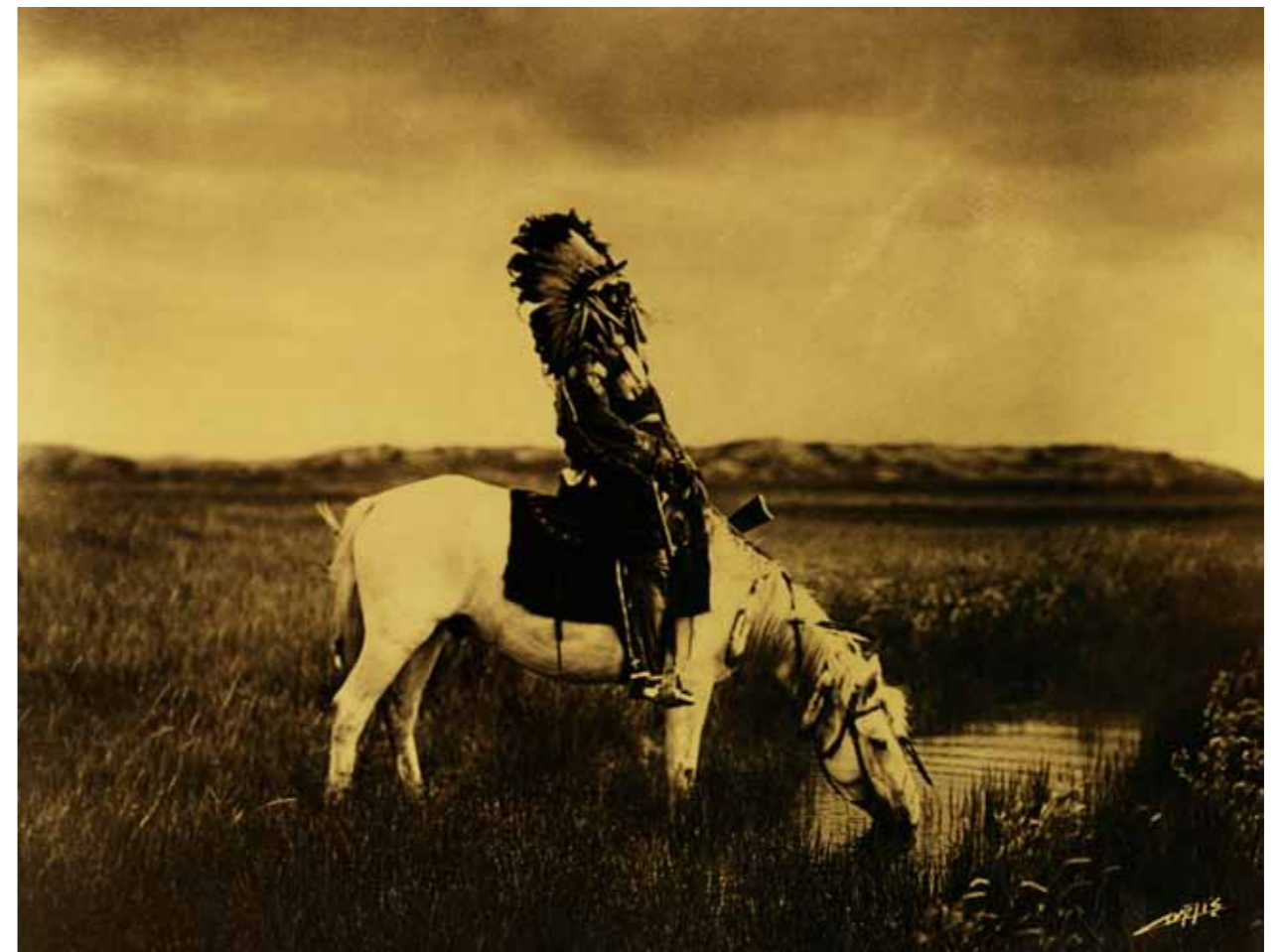
Chief Red Hawk, 1905.

Opgave 5: Analyser dette bildet med tanke på amerikansk historie.