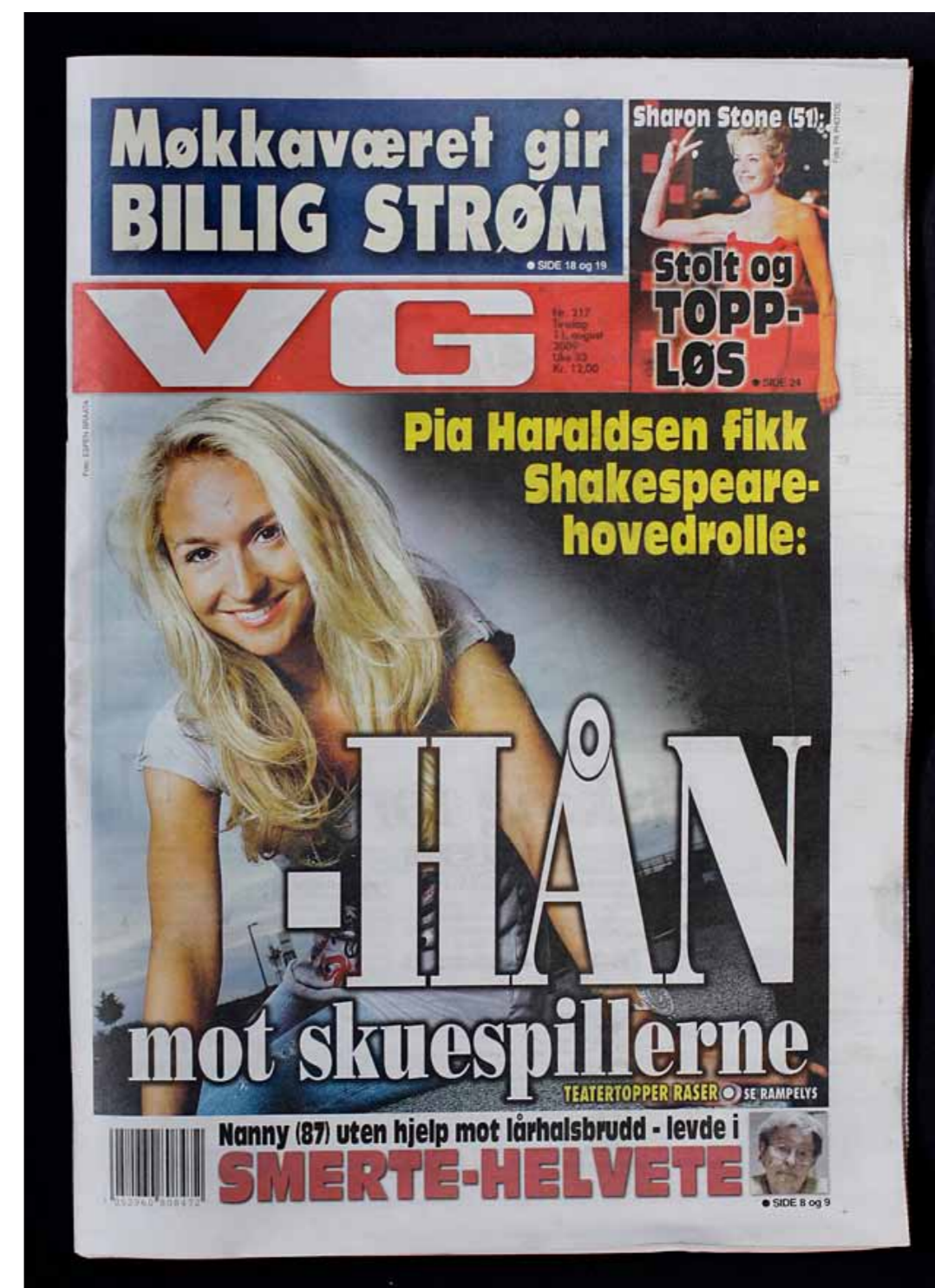
Faksimile av forside til dagsavisen VG 11. august 2009.

Oppgave 3: Analyser en nyhetssending på fjernsyn. Hvordan brukes tekst og grafikk i sendingene? Hvilken funksjon har grafikk- og tekstelementene?