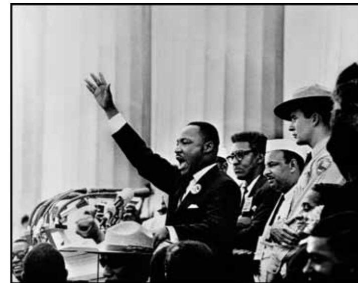
Martin Luther King jr. holder sin berømte tale «I have a dream» i 1963.

Obama brukte USAs historie i valgkampen. Hans måte å kombinere historie, politikk og personlig bakgrunn på i talene ligner på hvordan Martin Luther King jr. bygde opp sine taler. Obama har til og med brukt deler av Kings tale "I have a dream" om igjen.