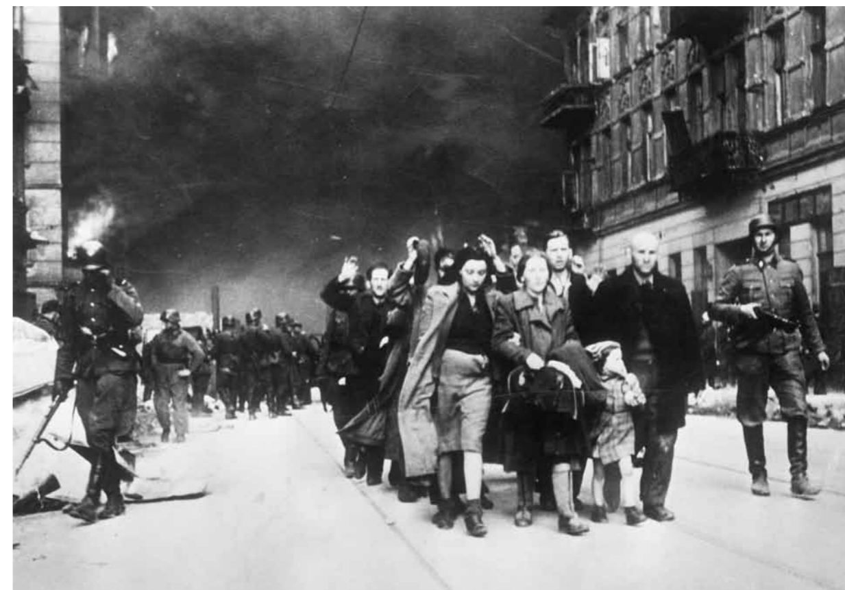
Deportering av jøder fra Warsava - gettoen, 1943.

Det fins imidlertid få bilder av hendelsen. Men de få bildene som nådde offentligheten, ble raskt sett av mange. De var viktige for å etablere støtte i den amerikanske befolkningen for senere å involvere seg i krigføringen i Europa.