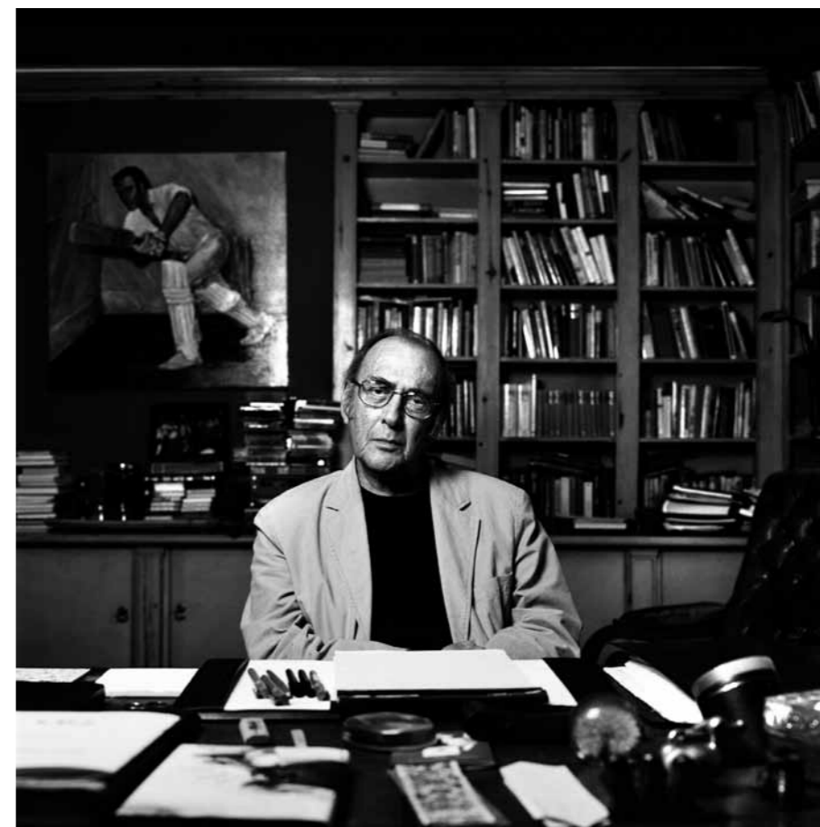
Portrett. Dramatikeren Harold Pinter.

Portrettet viser en eller flere personer som en tydelig og viktig del av bildet. Personene er lett gjenkjennelige, og de utgjør hovedmotivet. Bildet kan også vise personen i et miljø, for eksempel hjemme eller på arbeidsplassen. Da kalles bildet miljøportrett. Portrettene er som hovedregel arrangert.