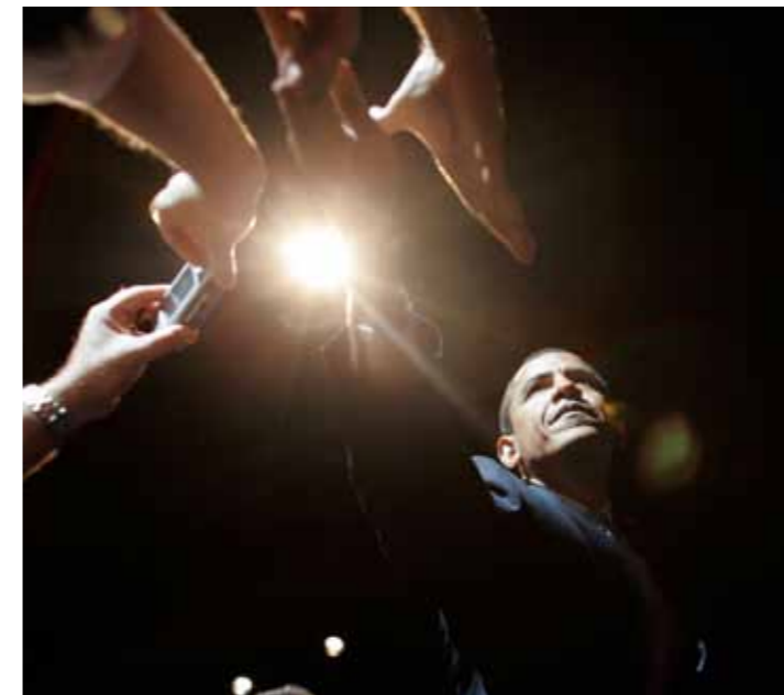
Demokratenes presidentkandidat, Barack Obama, etter en tale i august 2007.

Bildene av Obama og Luther King jr. kan analyseres med amerikansk historie som bakteppe. Men bildene avspeiler også makt i seg selv. En kan se på hvilke virkemidler fotografen benytter for å få fram storheten til Martin Luther King jr. og Barack Obama uten å tenke på rase.