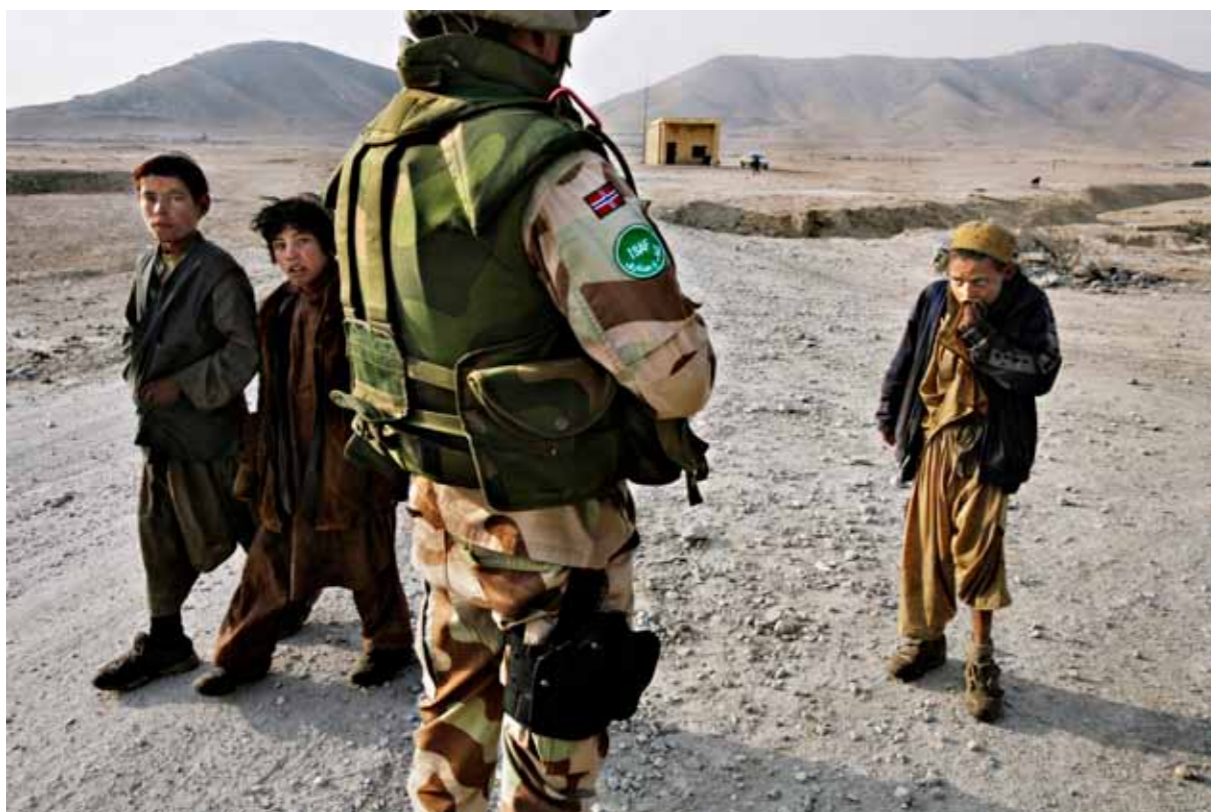
Reportasjebilde. Norske styrker i Afghanistan, 2005.

De redaksjonelle fotografiene kan grovt sett deles i to hovedkategorier: reportasjebildet og portrettet.