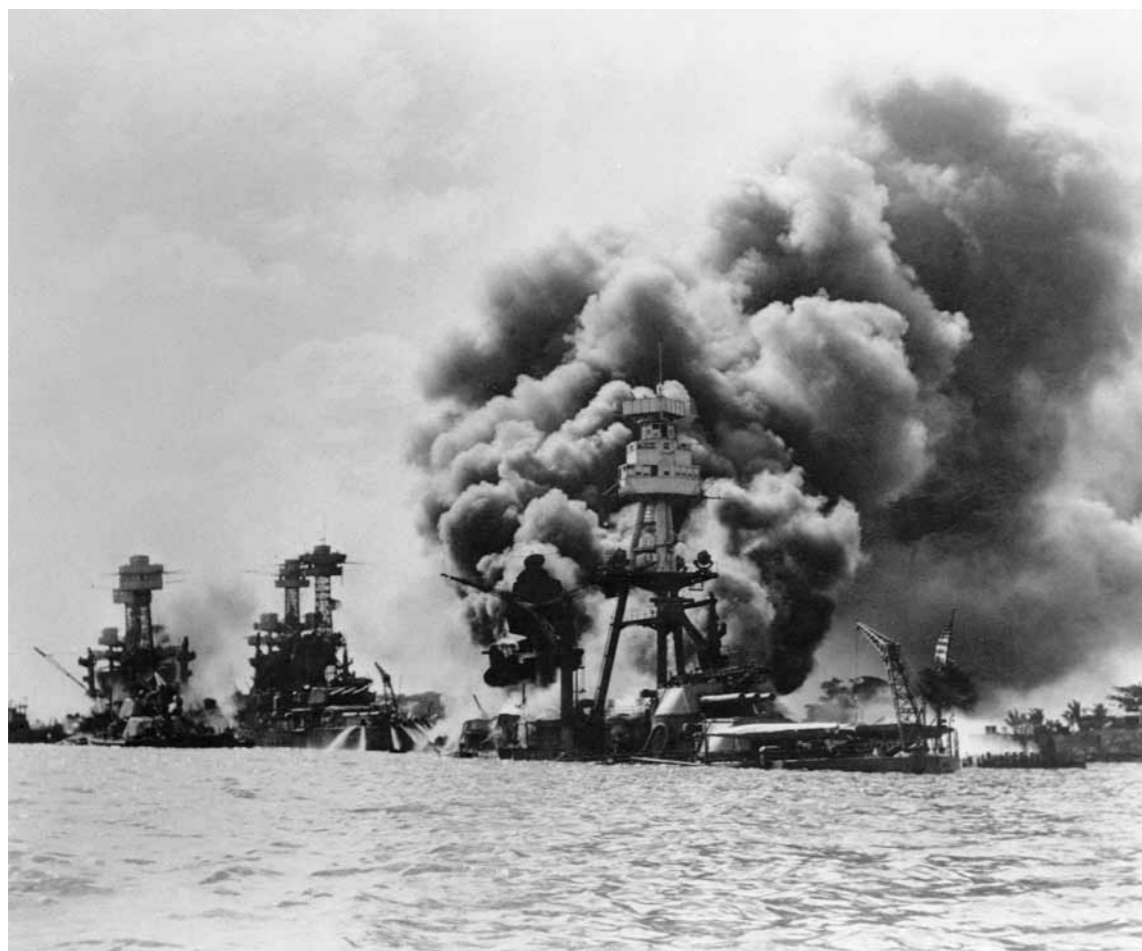
Bombingen av Pearl Harbor, 1941.

Under den annen verdenskrig var situasjonen en helt annen. Tilfanget av bilder som dokumenterte hendelser var begrenset. Det tok mye lenger tid fra hendelser fant sted til offentligheten fikk kjennskap til hva som hadde hendt.