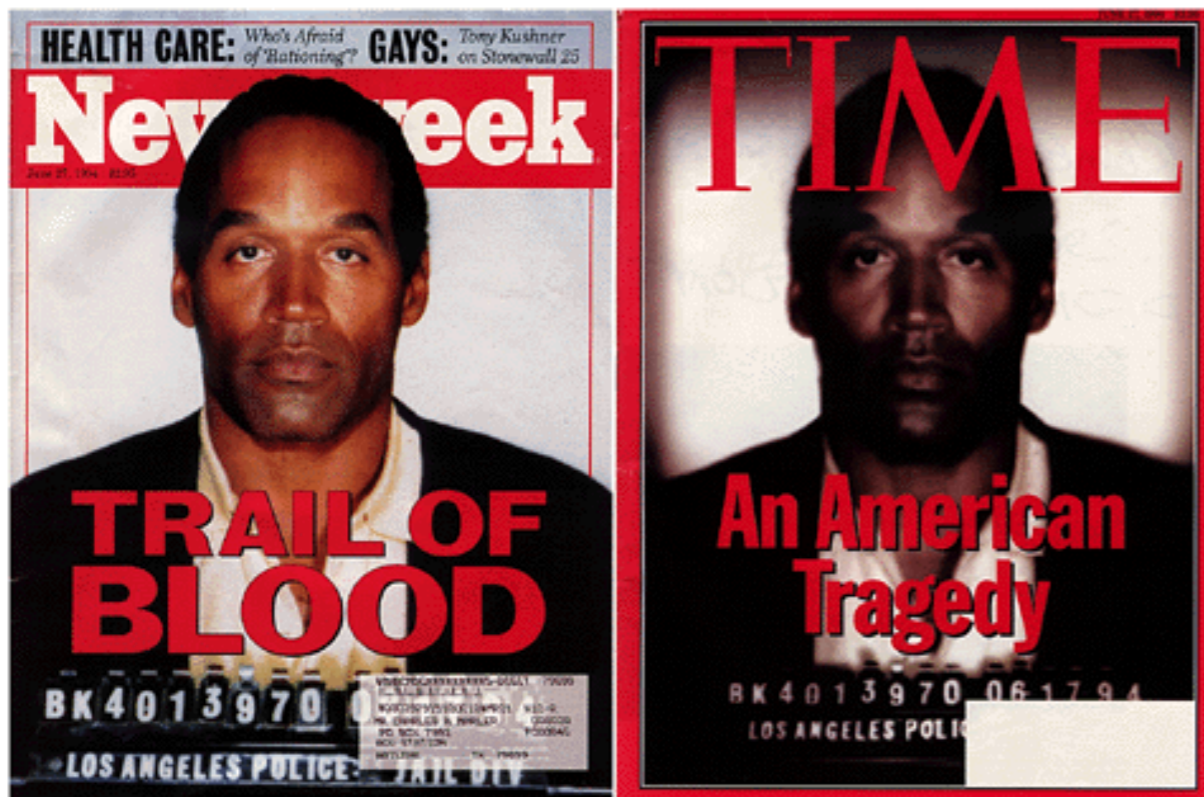
Faksimiler av forsiden til Newsweek og Time, 1994. Nyhetsmagasinene brukte det samme bildet på forsiden sine, men Time manipulerte bildet i et bildebehandlingsprogram.

Disse faksimilene er et klassisk eksempel på at fotografier kan manipuleres med et bildebehandlingsprogram.