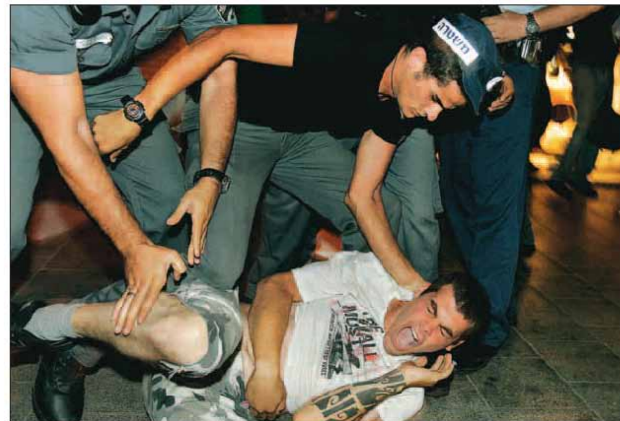
POLITIVOLD: Etter nærmere to timers fredelig marsjering gjennom Tel Avivs gater i går kveld, fikk politiet nok av irriterende demonstranter. På King George Street fikk demonstrasjonen en brå slutt. FOTO: PAUL SIGVE AMUNDSEN

Deretter ser vi på bildeteksten: «POLITIVOLD: Etter nærmere to timers fredelig marsjering gjennom Tel Avivs gater i går kveld, fikk politiet nok av irriterende demonstranter. På King George Street fikk demonstrasjonen en brå slutt. FOTO: Paul Sigve Amundsen»