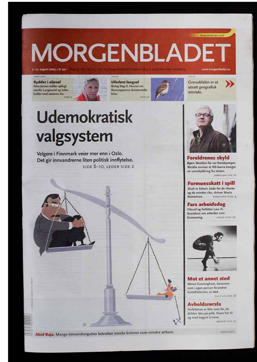
Faksimile av forsiden til ukeavisen Morgenbladet (uke 33).

Morgenbladet er en ukeavis som kommer ut hver fredag. Avisen koster kr 30 i løssalg, men en kan også abonnere på den. Logoen til avisen er plassert øverst på forsidene og består av hvite bokstaver på mørkerød bunn.