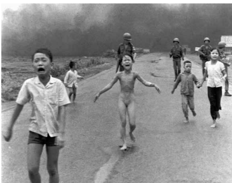
Dette bildet ble kåret til årets pressefoto i verden i 1972. Barn flykter fra napalmangrep.

De mange bildene av sivilbefolkningens lidelser var med på å bidra til at den amerikanske hæren trakk seg ut av landet i 1973.